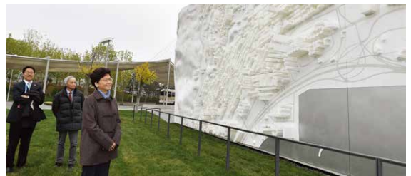
行政長官林鄭月娥女士親臨出席開幕式。

開幕當天更獲得行政長官林鄭月娥女士和其他政府官員特別親臨出席。公司團隊和客戶建築署代表亦齊赴當地視察項目落成的成果。