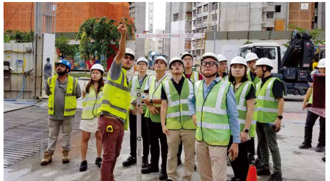
瑞安團隊參觀 MiC 工地。