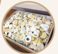
放入雪櫃冷藏兩小時，美味的雜果沙律便大功告成！