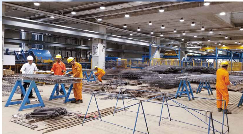
新加坡預製組件技術成熟，工場高度自動化。

今年5月，建築系工程部一行14人前赴新加坡，在新加坡建設局的安排下走訪當地建築師樓、工地和工場，觀摩以最新MiC技術建成的項目。