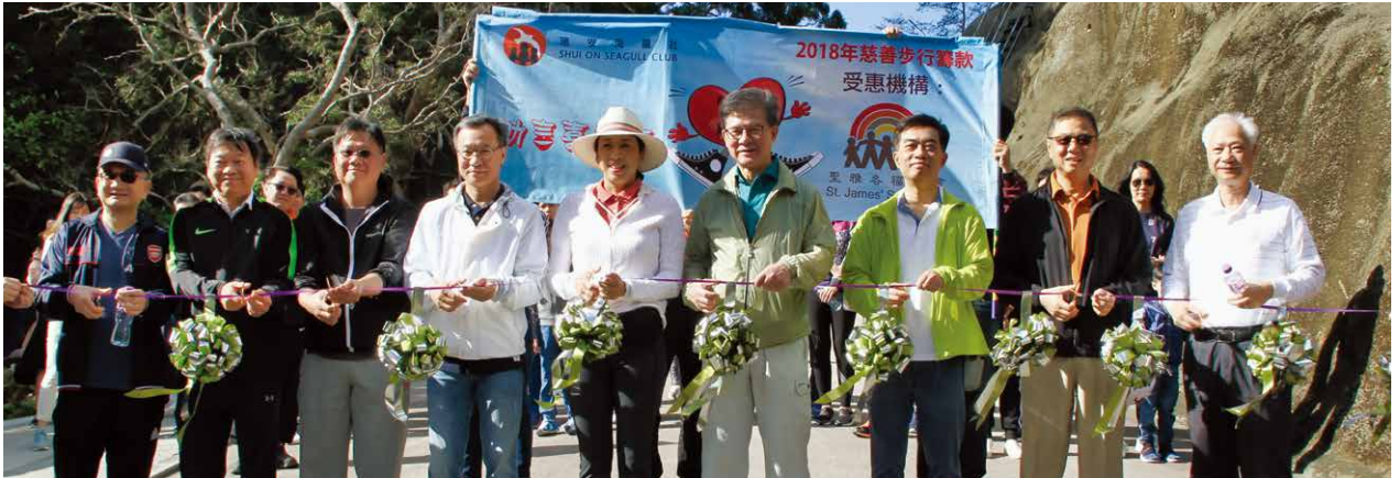
羅康瑞主席伉儷親臨支持一年一度的慈善步行。