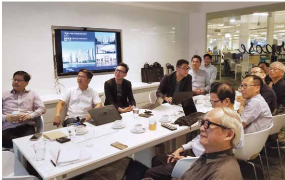
通過與建設局、建築師交流了解最新技術。