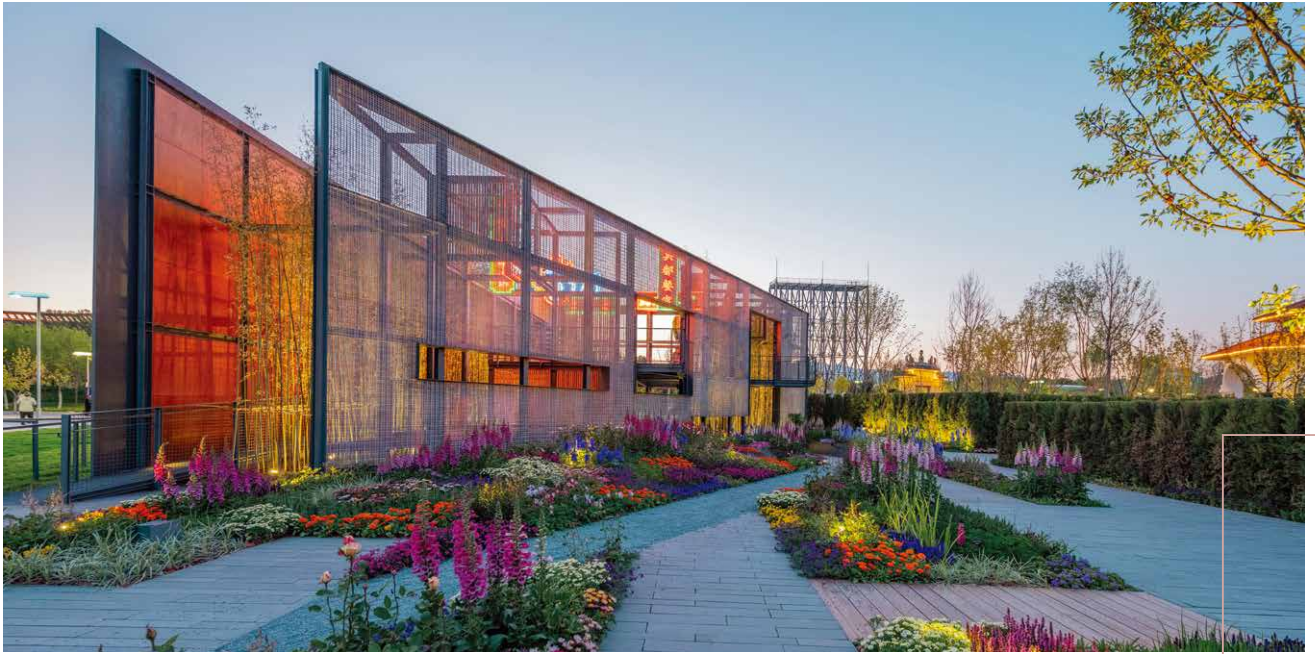
夜色下，香港園的燈效格外耀眼。