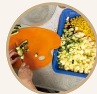
將切好的材料拌在一起，加入適量淡奶及沙律醬拌勻。