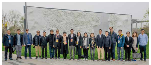
瑞安團隊與建築署代表一同參觀落成後的香港園。