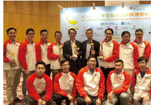
另外，瑞安承建在「第二十屆建造業安全分享會暨頒獎典禮」上亦榮獲 3 項金獎。

「建造業安全獎勵計劃 2018/2019」於 3 月舉行，瑞安建業共取得 9 個獎項。計劃由勞工處及多個建築業機構合辦，表揚在職業安全及健康方面表現優良的承建商、地盤從業員和前線工友，以推廣安全文化。