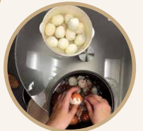
雞蛋煮熟後浸冷水，逐隻去殼及切片。