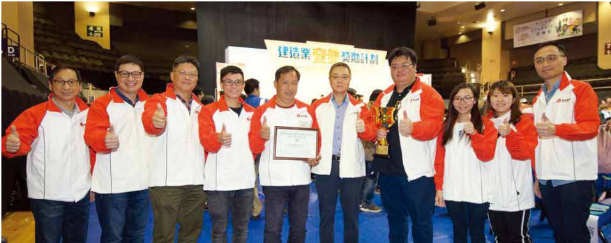
芬園警察宿舍項目團隊一同分享得獎喜悅。